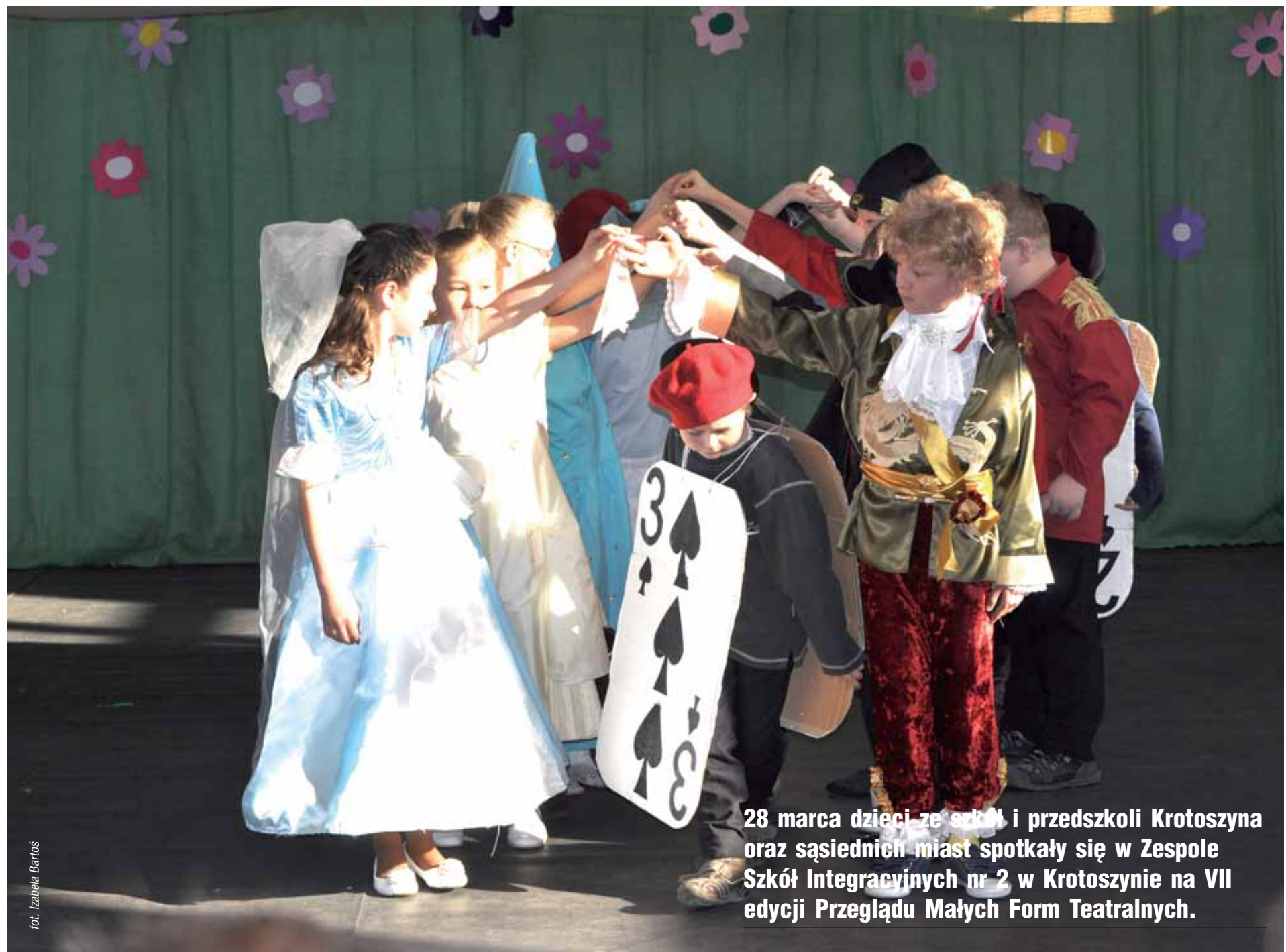
28 marca dzieci ze szkół i przedszkoli Krotoszyna oraz sąsiednich miast spotkały się w Zespole Szkół Integracyjnych nr 2 w Krotoszynie na VII edycji Przeglądu Małych Form Teatralnych.