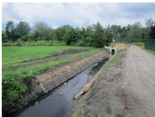
Roboty ziemne związane ze stabilizacją skarp płytami ażurowymi i darnią oraz przebudową przepustów na cieku RJ (część odkryta na odcinku od zaplecza Zespołu Szkół nr 3 przy Al. Powstańców Wielkopolskich w stronę ul. Witosa).

W części zakrytej cieku RJ (na odcinku od zaplecza Zespołu Szkół nr 3 przy Al. Powstańców Wielkopolskich do zaplecza sklepu „Biedronka”) ułożono kanał z rur betonowych. Na zapleczu Rynku (parking za „Rozchulantyną”) wymieniono istniejący kanał betonowy. Ponadto na odcinku od zaplecza ul. Floriańskiej do komory usytuowanej przy garażach obok „LIDL” ułożono kanał betonowy. Na odcinku od zaplecza Przedszkola nr 1 przy ul. Piastowskiej do ul. Sienkiewicza wykonano renowację kanałów metodą TROLINING (jest to system bezwykopowej rekonstrukcji kanału poprzez ułożenie wewnątrz kanału szczelnego rękawa z polietylenu wysokiej gęstości).