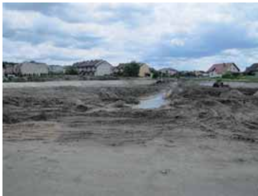
Roboty ziemne na suchym zbiorniku wód deszczowych nr 3 (w rejonie ul. Okrężnej).

Więcej szczegółowych informacji na temat Projektu (w tym także harmonogram realizacji inwestycji) można znaleźć również na stronie: www.krotoszyn.pl w zakładce: Projekty UE - JAWNIK.