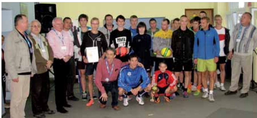
Pamiątkowe zdjęcie z nagrodzonymi uczestnikami turnieju

14 września pogoda nieco pokrzyżowała plany Radzie Osiedla nr 5, organizatorowi biesiady sąsiedzkiej „Wszyscy jesteśmy sąsiadami”.